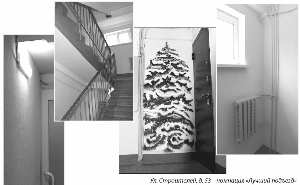
Ул. Строителей, д. 53 – номинация «Лучший подъезд»